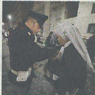
Roma blindata, pellegrini controllati

Roma blindata da 2mila agenti Fedeli in coda: non c'è paura