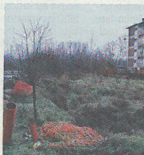
L'area di via Acerbi com'è oggi

Denunciato un dipendente comunale in servizio al cimitero di san Giovannino a Pavia: avrebbe intascato la "tassa" sui lumini votivi, rilasciando alla sua vittima una falsa ricevuta. Il caso è stato scoperto per caso quando la vittima ha ricevuto il sollecito (regolare) di pagamento e ha mostrato agli uffici la ricevuta fasulla.