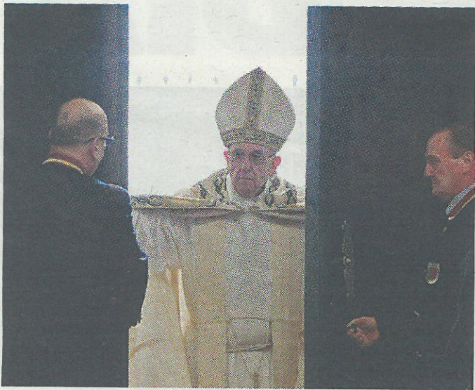
Papa Francesco apre la Porta Santa in San Pietro e dà il via al Giubileo