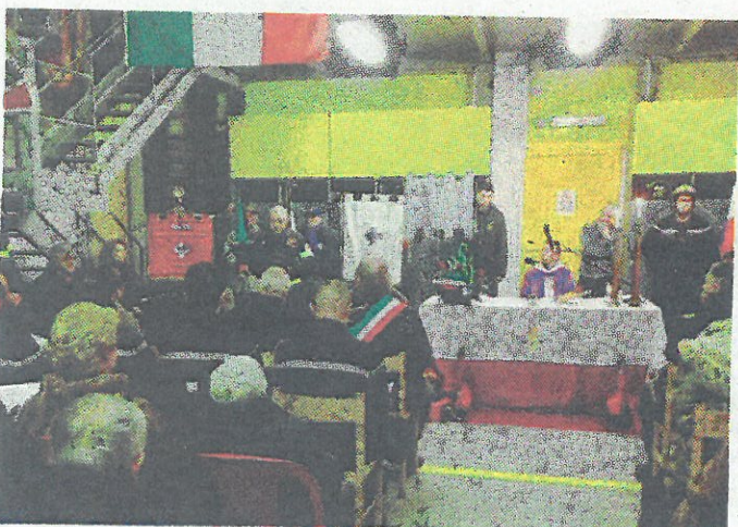
La sala è stata intitolata a Massara durante la messa per Santa Barbara

I contenitori per le pile si trovano in municipio, quelli per i farmaci scaduti nelle farmacie, quelle per le cartucce delle stampanti in municipio e nelle scuole, e quelli per gli oli esausti