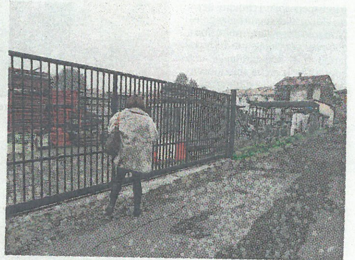
Il deposito di via Aleardi

La Toyota aveva il motore parzialmente smontato, ed era stata sollevata con dei