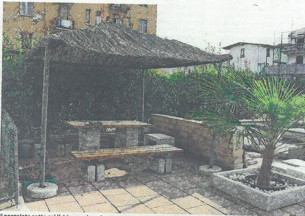
Il pergolato sotto cui il 46enne si era fermato a pranzare e dove si è sentito male dopo aver bevuto la bottiglietta

Anche tutte le altre quaranta bottigliette di acqua gasata da mezzo litro, della stessa marca e della stessa partita, erano state sequestrate subito dopo al bar e dal grossista che le aveva vendute, ma non è risultato che contenessero sostanze caustiche. In